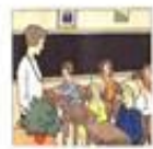
Die Klasse / třída