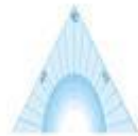
Das Dreieck / trojúhelník