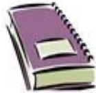
Das Buch / kniha