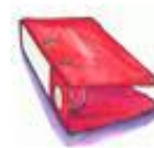
Der Ordner / скоросшиватель