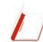
Die Mappe / папка