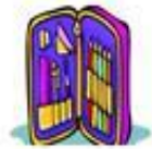
Das Mäppchen / пенал