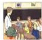
Die Klasse / класс