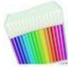
Der Buntstift / цветной карандаш