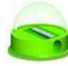
Der Spitzer / точилка