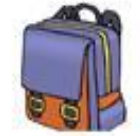
Die Schultasche / школьный портфель