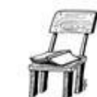
Der Stuhl / стул