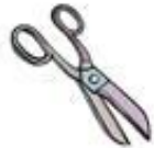
Die Schere / ножницы